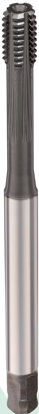
ridge of the furrow